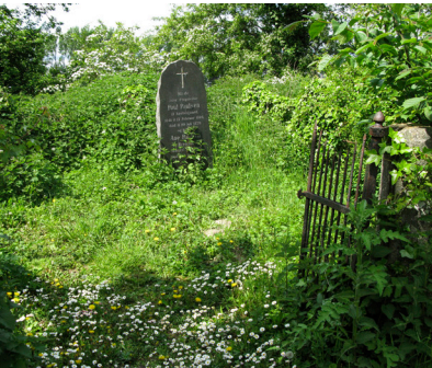
Stærkt patineret gravgitter. Foto: Mette Fauerskov, 2020.

jer, som sjældent ses i det omfang på en landsbykirkegård. Tilknytningen til Rolsøgård er ligeledes bemærkelsesværdig, idet langt de fleste af Rolsøgårds ejere i perioden fra 1816 og til i dag ligger begravet her. Gravmindernes tilstand varierer fra velbevarede til meget forfaldne.