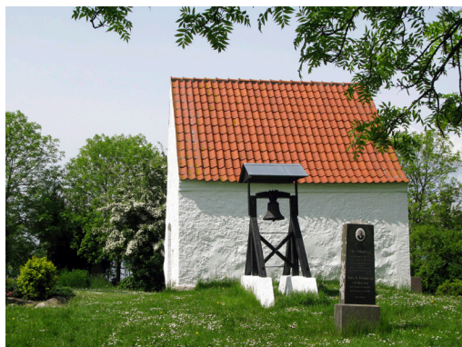
Kapel og klokkestabel, gamle gravminder samt høje og viltre navrhække, der omgiver tidligere gravsteder.

Der hersker en ganske særlig, fortættet stemning på kirkegården, dels på grund af beliggenheden, udsigten og kontrasten til omgivelserne, dels på grund af dens park- og naturprægede