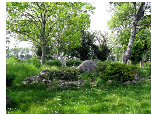
Gamle gravminder, digevegetation med reliktpanter samt et aktivt gravsted. Fotos: Mette Fauerskov, 2020.

Kapel og klokkestabel danner centrum ikke blot geografisk, men også som kirkegårdens åndelige og historiske tyngdepunkt. Hele kirkegårdsarealet er livgivende grønt, hvilket i