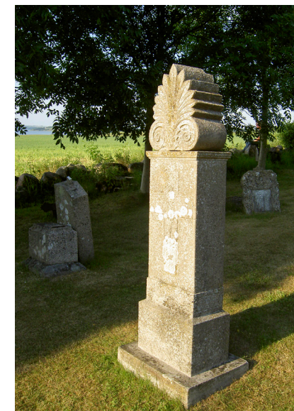
Gravsten fra 1801 i form af en obelisk kronet med en akroterion, som oprindeligt var et ornament placeret på græske tempelgavle. Foto: Anne Marie Møller, 2013.

Løjtnant, Bernt, "Reliktplanter, levende fortidsminder", Botanisk Forening, 2017. https://botaniskforening.dk/wp-content/uploads/2018/04/Rettet-RELIKTPLANTER.pdf .