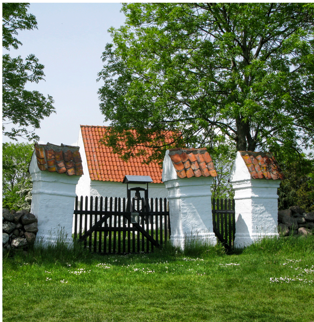
Malerisk lågeparti til Rolsø Kirkegård med kig til det lille hvidkalkede kapel. Foto: Mette Fauerskov, 2020.