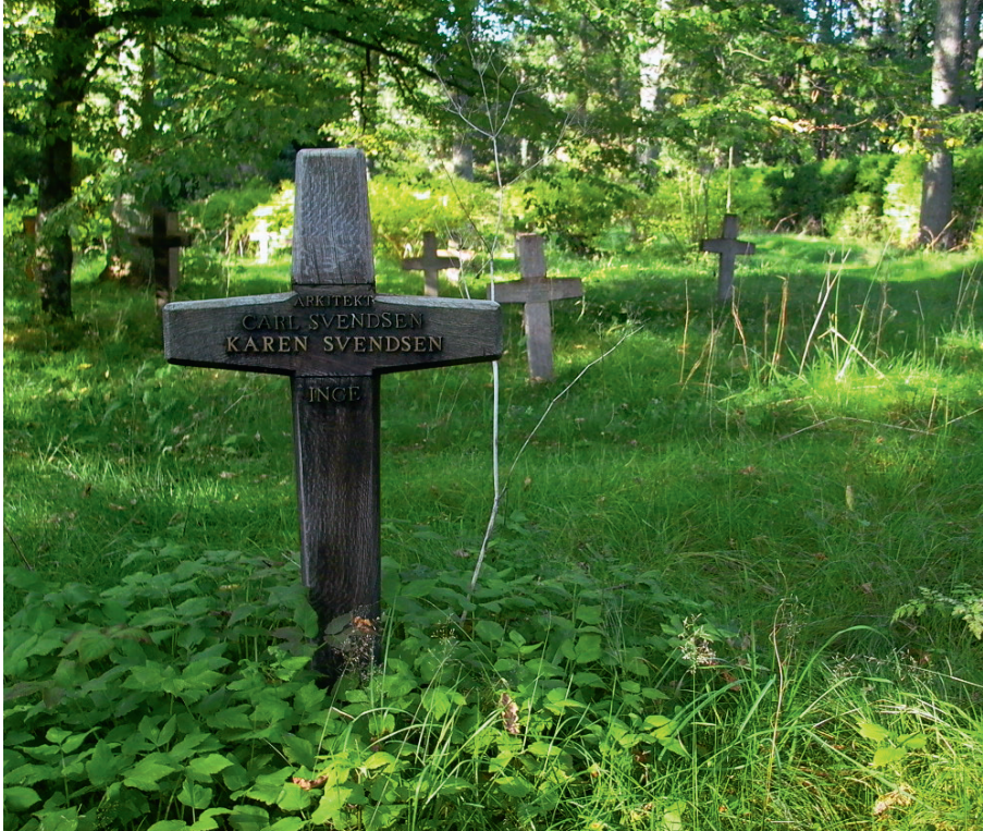
Skovafsnit på Mariebjerg Kirkegård, der er anlagt efter plan af landskabsarkitekt G.N. Brandt.

Ét af de væsentlige, overordnede karaktertræk ved de danske kirkegårde er, at de også i dag er grønne. Det hænger sammen med, at vi her i landet er beriget med det naturgivne vilkår, at jordoverfladen og mulden er til for at være plantedækket. I naturen dækkes jorden af de planter, græsser, urter og træer, som det givne steds betingelser og udviklingsstadium tilsiger. I haver, parker og på kirkegårde er det vi mennesker, der kan bestemme, hvilke planter og hvilken grad af dyrket/naturligt udtryk vi ønsker. Jorden skal ikke camoufleres, men er et potentiale for dyrkning. Uagtet tidernes skiftende natursyn har vi danskere således en urgammel tilknytning til og identifikation med det sansede grønne, frodigheden og det dyrkede land, som er så grundlæggende og betydningsfuldt, at det har en lindrende og glædende virkning på os. Derfor skal de fysiske kirkegårde fortsat være grønne og frodige anlæg.