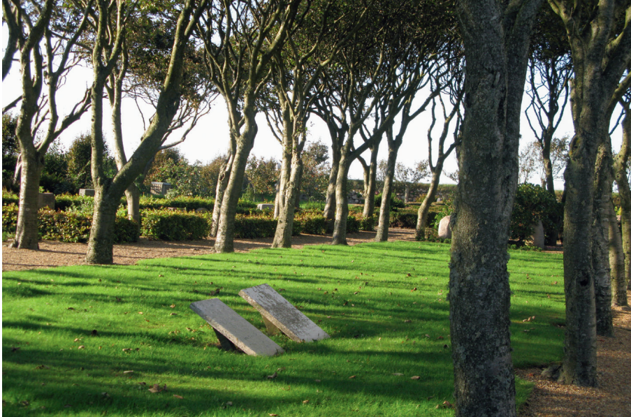
Allée og træerækker på Gl. Sogn Kirtegård, Ringkøbing Provsti, giver identitet til et område, der ikke er i brug til gravsteder.

værdifulde beplantninger og gravstedsplanter er fjernet, og formklippede træer og træer, der "sviner", er blevet fældet. Når der af frygt for at belaste driftsøkonomien ikke bliver etableret erstatningsplantninger eller nye grønne strukturer, der kan skabe nye helheder, bliver konsekvensen, at anlæggene mister helhed, sammenhængskraft, frodighed og dynamik.