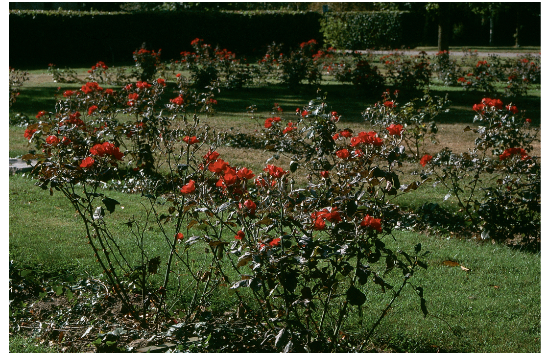
Rose Amsterdam i bund af småbladet vedbend, Hedera helix 'Hesma'

For at sikre, at gravminderne indgår som en del af Rosenhavens helhed, er det dog fastlagt, at de skal være liggende, at de skal holde sig indenfor bestemte maksimale mål, samt at der ved hvert gravsted kun er mulighed for at placere én buket afskårne blomster.