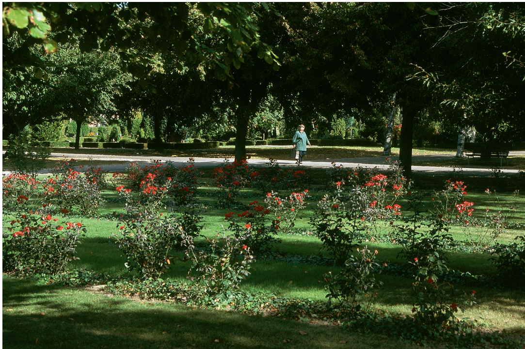
Rosenhaven, 2. etape.

betydningsgivende. Også i de enkelte bede er der pauser, idet det er sikret, at der højst kommer til at ligge 4 gravsten ved siden af hinanden.