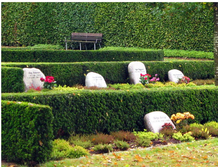
Gravsted med opretstående gravminde i et bed med plads til både kister og urner.