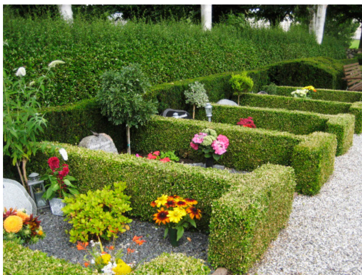
Hækafgrænset, individuelt gravsted med plads til urner.

I "Kvalitetsbeskrivelser for Kirkegårde" er der god inspiration til, hvilke krav der kan stilles til pleje og vedligeholdelse af et gravsted.