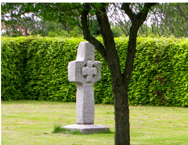
Anonyme gravsteder for kister og urner.