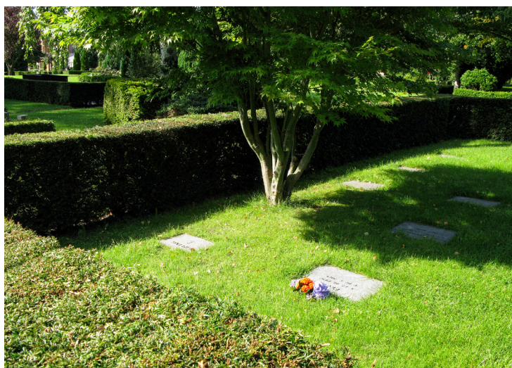
Gravsted med liggende gravminde i græs med plads til både kister og urner.