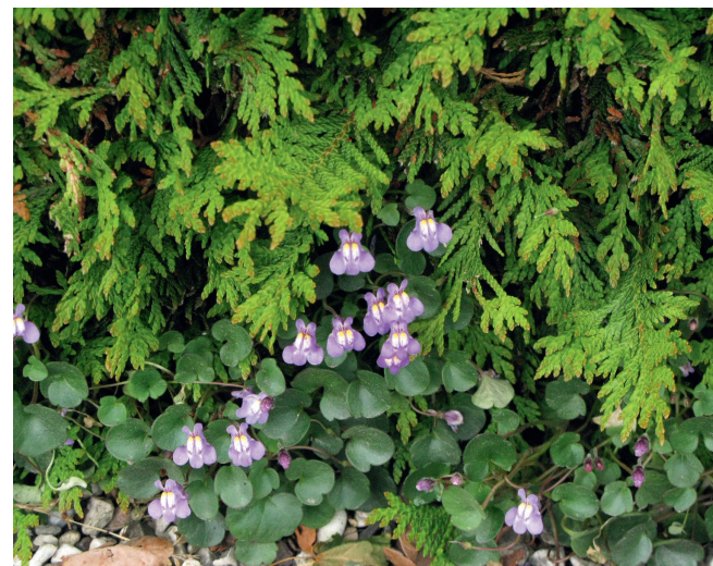
Selvsået torskemund der får lov at vokse langs en hæk. Karlby Kirkegård, Syddjurs Provsti. Foto: Mette Fauerskov 2009.

En mere nuanceret tilgang til drift og indretning af vore kirkegårde er ønskelig, både for at anlæggene kan blive mere sanselige og varierede, og for at de kan imødekomme et bredere spektrum af brugernes holdninger til et haveanlæg og deres forestilling om et paradys. I bogen "Haven, paradys eller slagmark" 3 inddeler og karakteriserer sociologen Bella Marckmann de danske haveejere i fire typer, efter hvilken holdning mennesker har til deres have: "Slapperen", "Ordensaktivisten", "Økorumantikeren" og "Nusseren". Tager man udgangspunkt i, at kirkegårde er haver, kan begreberne overføres til kirkegårdene. Men på de danske kirkegårde er det næsten kun ordensaktivisternes holdning, der hersker.