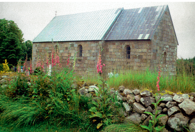
Diget ved Torsted Kirke, Ringkøbing Provsti har en forbilledlig frodighed med mange reliktpanter. Foto: Mette Fauerskov 2001.

Både på Egens Kirkegård og på Tøndering Kirkegård vil der, når de nødvendige investeringer er gjort, være den sidegevinst, at driftsudgifterne på sigt bliver reduceret og kommer til at stå bedre i forhold til kirkegårdens indtægter.