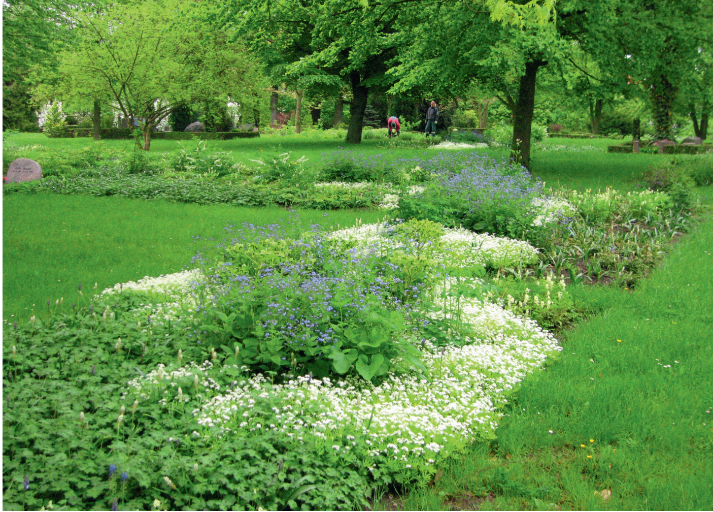
Ny gravstedstype med skovbundsinspireret bundplantning er indpasset mellem eksisterende traditionelle gravsteder. Nattergalenlunden, Aarhus Vestre Kirkegård.

En anden strategi kan være at holde hele kirkegården aktiv med spredtliggende, traditionelle gravsteder og grupper af andre gravstedstyper, som indpasses i en landskabsarkitektonisk sammenhængende struktur. De to strategier kan naturligvis kombineres på mange måder, så de tilpasses de stedlige forhold og behov på hver enkelt kirkegård.