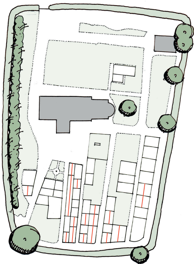
Tøndering Kirkegård i dag. Hvide arealer er grus. Gravsteder med rød streg er ledige. Kirkegården fremtræder gold og "affolket".

For kirkegården er der udarbejdet en udviklingsplan, hvis hovedidé er, at den som helhed skal være grøn og med et naturpræget, "råt" og samtidig sanseligt udtryk, der harmonerer med det omgivende landskab, samtidig med at det vidtstrakte ud- og indsyn fastholdes. En