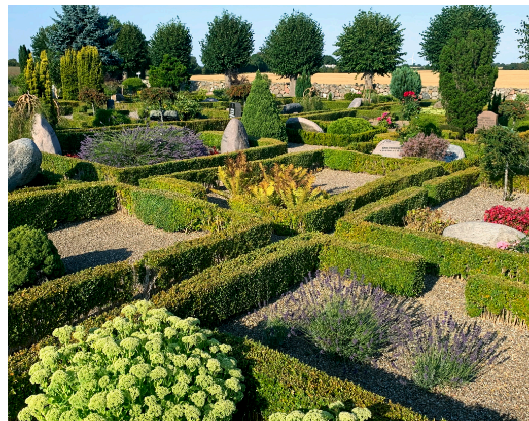
Gravstederne er organiseret i et fuldstændigt præcist mønster med gennemgående smalle stier i både nord-sydlig og i øst-vestlig retning. Foto: Mette Fauerskov, 2020.