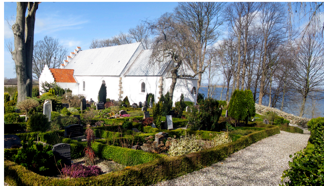
Der er i dag omkring 50 sekspladsers gravsteder på kirkegården, hvorfra der er udsigt over Knebel Vig. Foto: Mette Fauerskov, 2014.