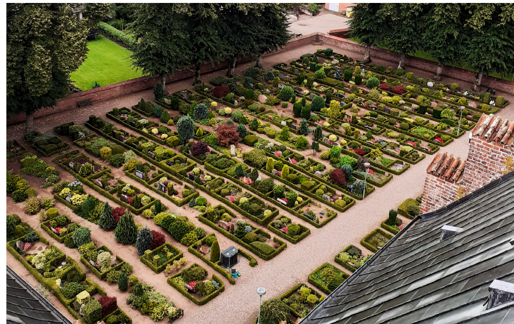
Løgumkloster Kirkegårds nordøstlige del set fra kirketårnet.