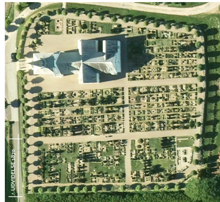
Vilstrup Kirkegård er udvidet mod syd i 1870 og igen i 1911.

Gravstedsstrukturen viser tilbage til tiden før de store reguleringer i 1920-60, hvor det var den enkelte gravstedsejer, og ikke kirkegårdens personale, der forestod etablering og pleje af gravstedet og gravstedshækkene. Derfor ses det på nogle af disse kirkegårde, at der er anvendt forskellige plantesorter til hækkene. På de fire kirkegårde (Bogø Kirkegård i Roskilde Stift, Lyø Kirkegård i Fyens Stift, Nordby Kirkegård i Aarhus Stift og Vilstrup Kirkegård i Haderslev Stift), hvor gravstedsstrukturen er intakt, ses strukturen i forskellige variationer. Der findes flere kirkegårde, bl.a. på Ærø, Strynø og Lange-land samt på Læsø, der tidligere har haft denne struktur, og hvor den stadig er aflæselig, selv om strukturen ikke længere er intakt.