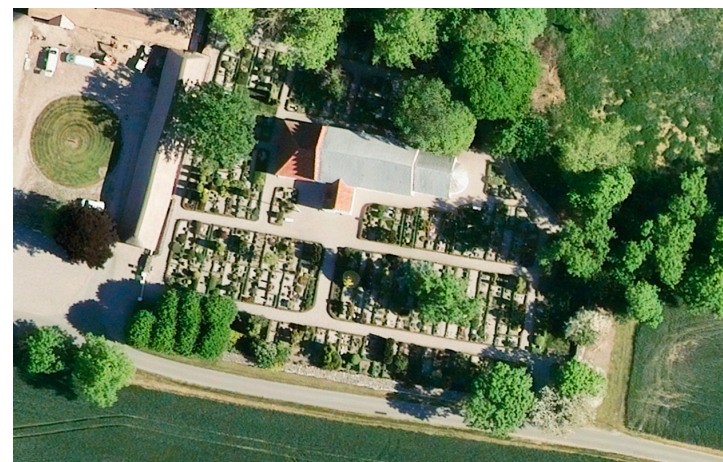
Tved Kirkegård har sandsynligvis bevaret sin oprindelige udstrækning.

Lige oven for kystskrænten ned mod Knebel Vig på Mols udgør Tved Kirke, Kirkegård og den fredede præstegård et organisk og usædvanligt idyllisk kulturmiljø. Arealerne på Kongsøre Hage ved Tved Kirke er omfattet af en fredning, der har til formål dels at bevare det kulturhistoriske miljø omkring kirken og præstegården, dels at bevare de særlige geologiske og biologiske forhold, men selve kirkegården er ikke fredet. Den markante, træbevoksede skråning uden for norddiget danner ryg for anlægget, der i et og alt udstråler