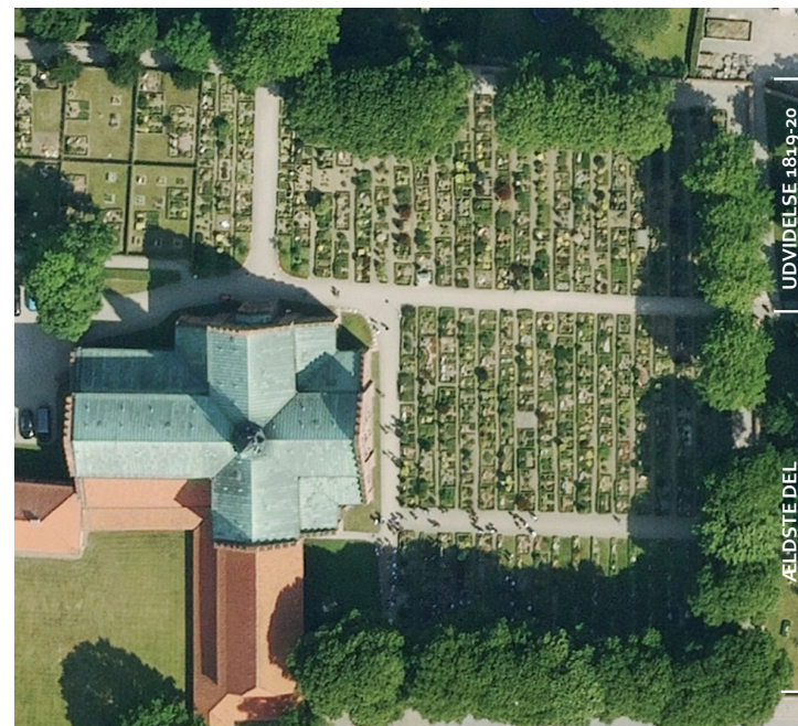
Løgumkloster Kirkegårds ældre del. Uden for fotoudsnittet er kirkegården udvidet mod øst i 1923 og flere gange senere, samt mod nord i 1990'erne.

lig i græs og var markeret af enkle gravminder. Frem mod 1950'erne ensartedes gravstedernes afgrænsning, flere gravsteder fik hække i forskellig højde og bredde, mens andre gravsteder stadig var gitterkransede, enkelte var omgivet af