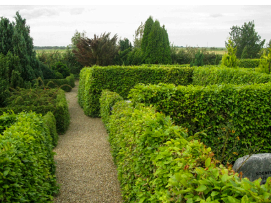
Gravstedsstrukturen på Sneum Kirkegård er labyrintisk, fordi den ikke er færdigreguleret, stiernes bredde varierer, hækene er høje og har forskellig højde.

Den sidste kategori af kirkegårdsanlæg med bevaringsværdig gravstedsstruktur omfatter anlæg, hvor den mest kendte type med dobbelte gravstedsrækker ikke er færdiggjort, og hvor kirkegården derfor har et labyrintisk præg. I denne kategori finder vi Sneum Kirkegård i Ribe Stift, hvis labyrintiske struktur understreges af mange forskellige sorter af gravstedshække, der holdes klippet i forskellige højder.